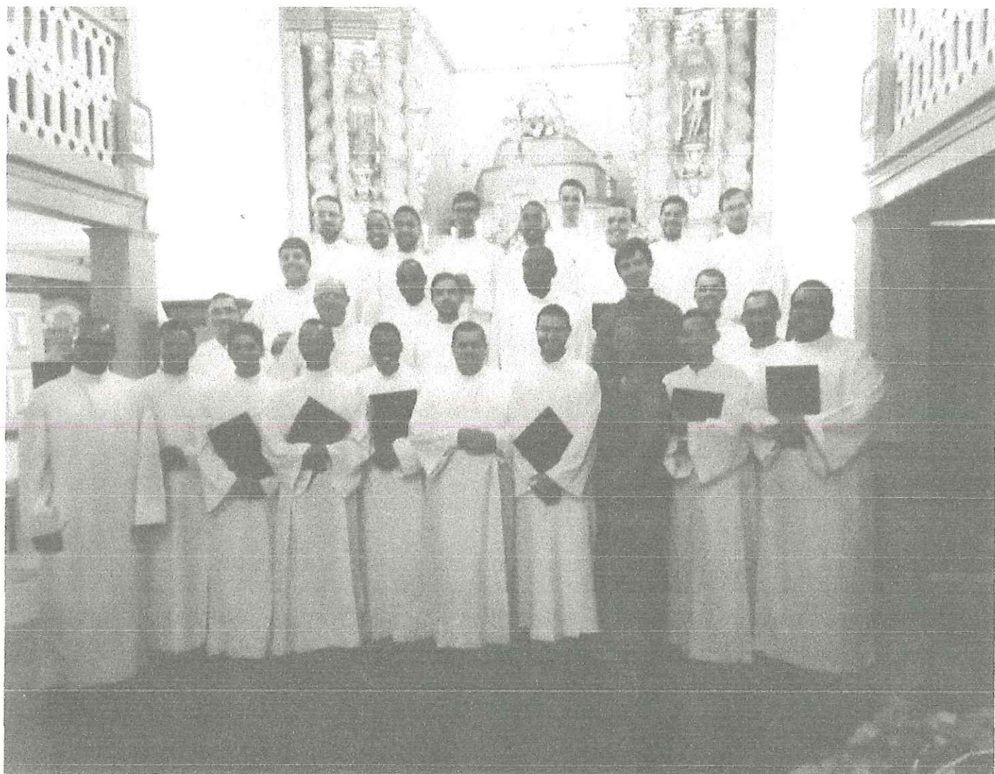
(FOTO: Coral do Seminário de Mariana na Apresentação em Cachoeira do Brumado – 29/11/2018)